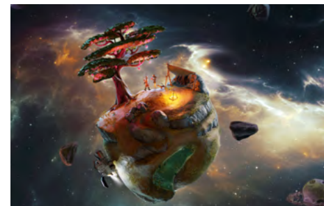
Oto's Planet → cf. page 24