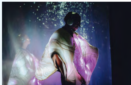
Ceci est mon cœur → cf. page 8