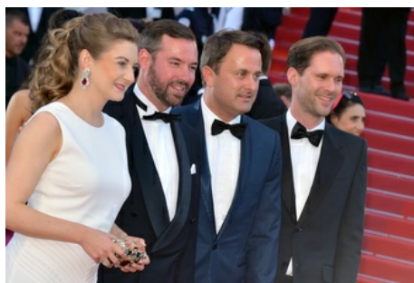
Le Luxembourg bien représenté au 70e Festival de Cannes